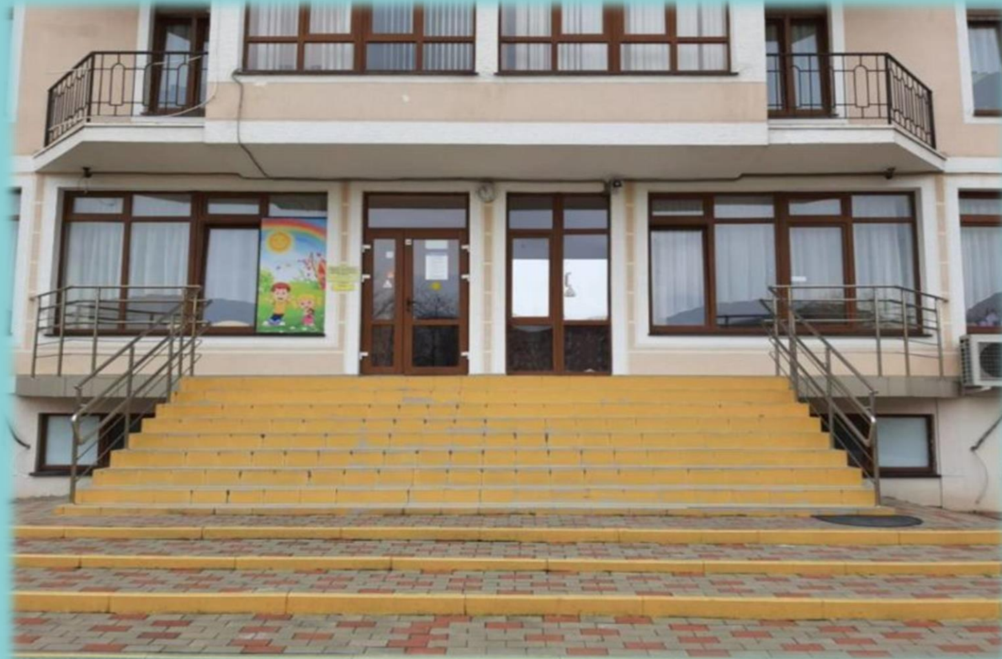
Краснодарский край, г. Геленджик, ул. Крымская, д. 19 корпус 11